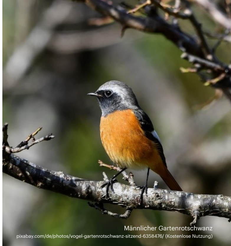
Männlicher Gartenrotschwanz

Denn es sind solche kleinen Begegnungen wie mein Wiedersehen mit dem «Gaderöteli», die mir zeigen, dass sich jeder Einsatz für die Natur lohnt. Sie werden im Newsletter lesen können, wie BirdLife Sarganserland im letzten halben Jahr in Kursen Freude und Fachwissen über die Vogelwelt verbreitet hat und mit verschiedenen Aktionen die Bevölkerung für Naturthemen zu sensibilisieren versuchte. Auf einem Ausflug zum Farnsberg erhielten Interessierte einen Einblick in eine Landwirtschaftsform, die für Mensch und Natur