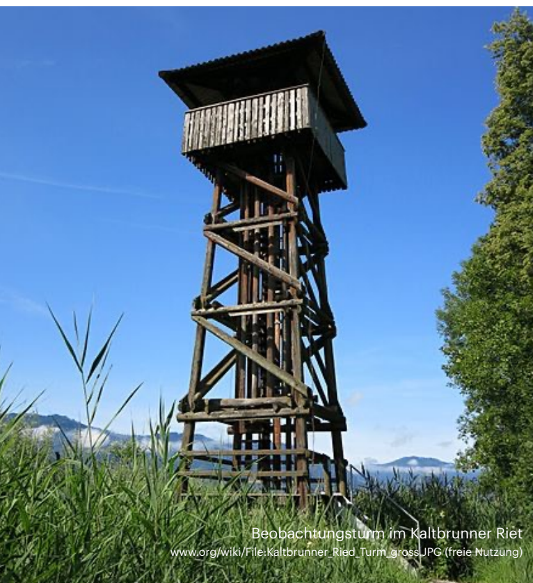
Beobachtungsturm im Kaltbrunner Ried